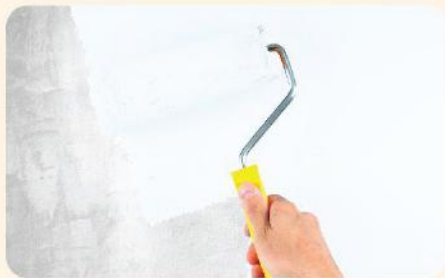
กลบพื้นผิวดีเยี่ยม

นิปปอน 5200 วอลล์ ซีลเลอร์ ที่เต็มไปด้วยคุณภาพที่แตกต่างจากสีรองพื้นทั่วไป พลาสติกจากกาวสูตรพิเศษเฉพาะนิปปอนเพนต์ ที่ถูกออกแบบให้เน้นการกลบพื้นผิว ช่วยเพิ่มประสิทธิภาพสูงสุดให้กับสีทับหน้า และยังให้ฟิล์มสีที่เรียบเนียน