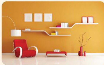
ฟิล์มสีเรียบเนียน