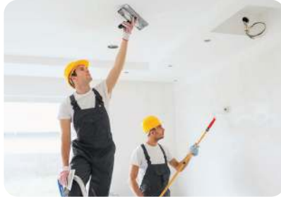
ทาได้ทั้งผนังและฝ้าเพดาน