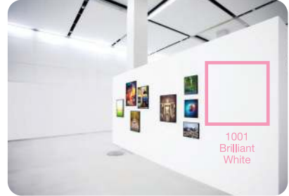
ทาสีที่ได้นานกว่า