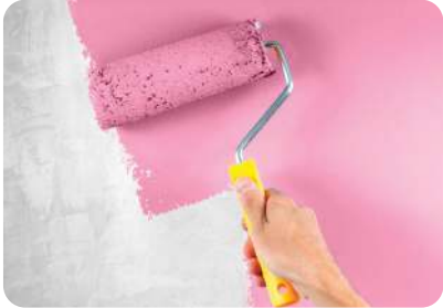
กลบพื้นผิวดีเยี่ยม

คุณสมบัติที่โดดเด่น เป็นสีน้ำทาภายในสูตรพิเศษที่ดูออกแบบมาโดยเฉพาะ: