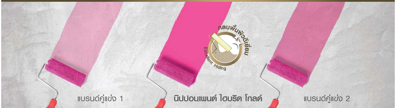
แบรนด์คู่แข่ง 1